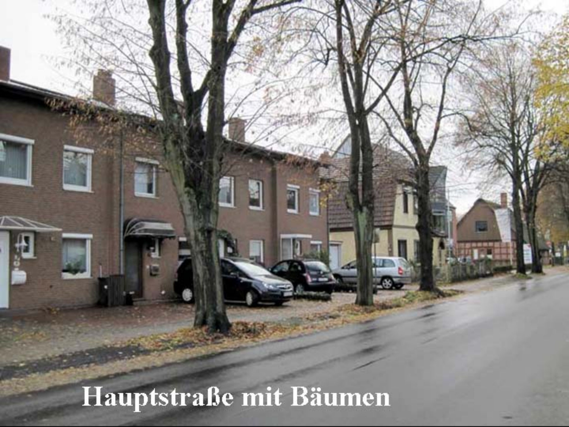
Hauptstraße mit Bäumen